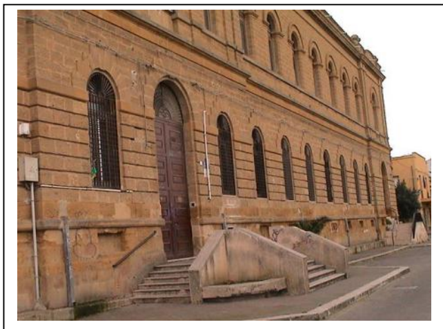
Veduta esterna del plesso "Vincenzo Guarnaccia"